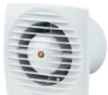
EXTRACTOR DE AIRE ANDES