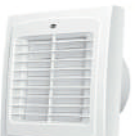
EXTRACTOR DE AIRE EVEREST