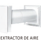
EXTRACTOR DE AIRE HIMALAYA