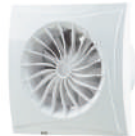
EXTRACTOR DE AIRE ASPEN