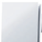
EXTRACTOR DE AIRE BIANCO